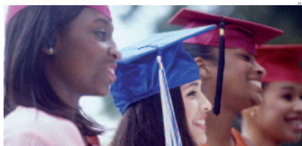
Laureati con la valigia. Un gruppo di neolaureati provenienti da Paesi in via di sviluppo. Secondo l'Unctad, in Africa la più elevata percentuale di emigrazione tra il personale qualificato si registra in Somalia (58,6%)

Ingegneri, medici, programmatori informatici, queste le principali tipologie di lavoratori che i Paesi industrializzati sono ben felici di accogliere. Il rapporto afferma infatti che se da un lato, a causa di guerre, povertà e poche possibilità di far carriera, i laureati emigrano, dall'altro i Paesi ricchi hanno incentivato questo fenomeno attraverso politiche mirate e leggi apposite. Tre i fattori determinanti che hanno alimentato il bisogno di lavoratori specializzati: l'invecchiamento della popolazione, che richiede sempre maggiori investimenti in strutture e personale medico; la rivoluzione tecnologica, che ha enormemente aumentato la richiesta di personale qualificato; la sempre minore attrattività di certe professioni (insegnanti, inge-